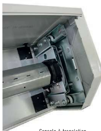
Console à translation

L'axe d'enroulement est monté sur console à translation et apporte à « Hawai 77 Plus » une extraordinaire souplesse de fonctionnement.