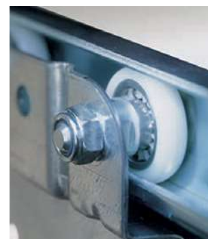
Galet nylon et roulement à billes