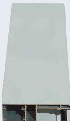
Coulisses section 105 x 42 mm

Le tablier est guidé et maintenu dans deux profondes coulisses amenant une forte résistance à l'éfraction et au vent.