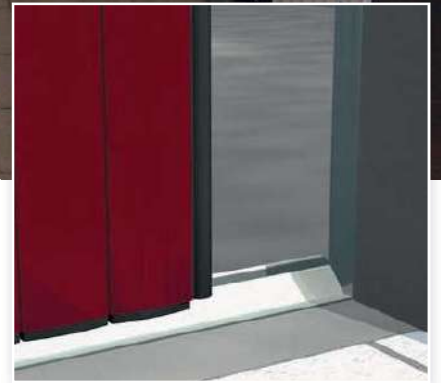
L'étanchéité est assurée par des joints spéciaux sur toute la périphérie.