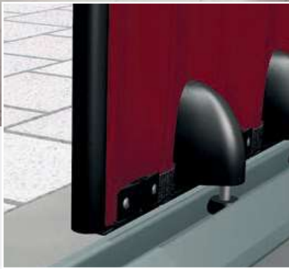
Battue latérale + rail bas