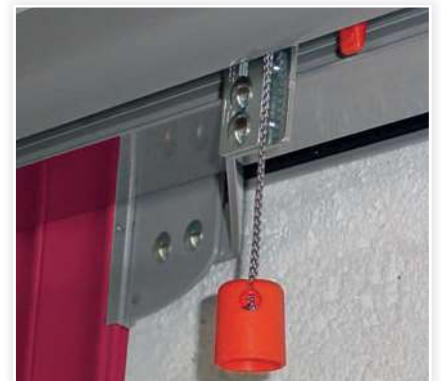
Possibilité de déverrouillage extérieur.