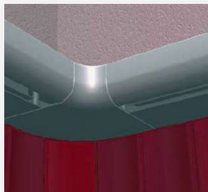
Une pièce d'angle en aluminium assure la liaison entre le rail linteau et le rail retour.