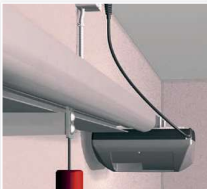
Le rail moteur est encastré dans le rail aluminium, il peut être placé en fonction des possibilités dans le rail linteau ou le rail retour. Galets de suspension sur chaque lame.